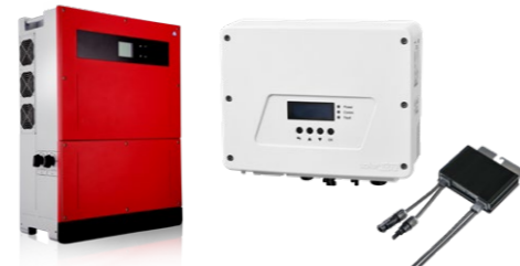
String omvormers en string omvormers met optimizers